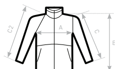
C2= RAGLAN SLEEVE